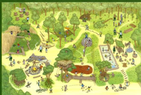
パルパーク・プロジェクト 北九州市山田緑地公園イメージ 小学館 BE-PAL