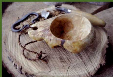
樺の櫛の Kuksa (ククサ)