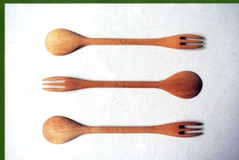
アウトドア用カトラリー「ツリースポーク」(ミネバリ材) 制作:柳澤木工所