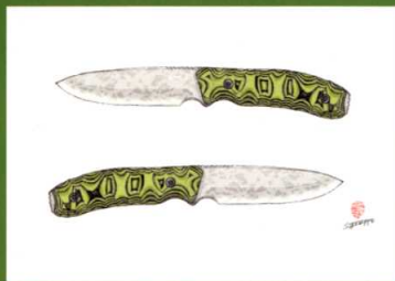
ブッシュクラフトナイフ「野槌 (Nozuchi)」 製作：松田菊男