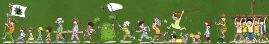
「バレルパーク」小学館 BE-PAL