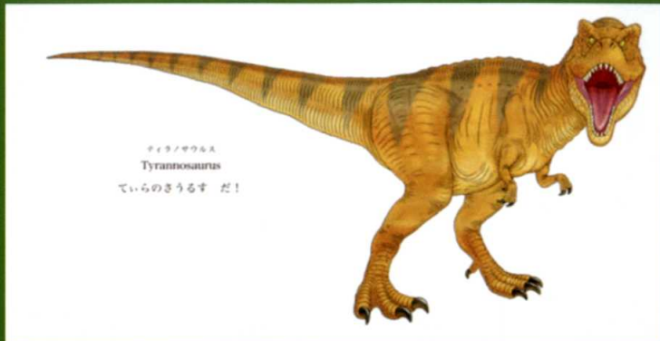
「きょうりゅう」えほんの杜