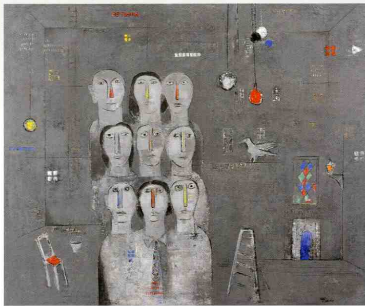
「喜劇・千秋楽」 2011年/油彩