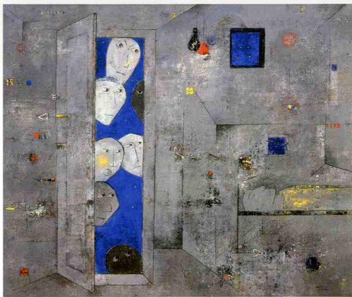
「星降る夜に」 2007年/油彩

半世紀以上の長きにわたり春陽会に所属し、85歳の今もお真摯に油彩画に向き合い、自らの飽くなき芸術表現を探索する浦野吉人の画業集大成となる本展を、是非この機会にご覧ください。